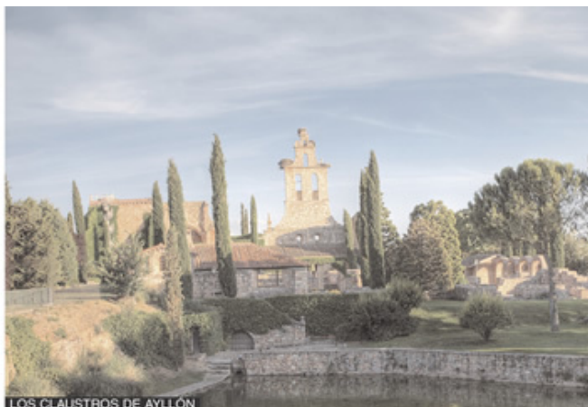
LOS CLAUSTROS DE AYLLÓN

Rodeado de jardines de estilo árabe-andaluz, este monumento histórico-artístico y hacienda de olivar, ha sido restaurado al mínimo detalle. En su interior verás auténticas obras de arte. (Ruta de los pueblos blancos, a 29 km. de Jerez. Tel: 913 10 09 65 -639 670 860. www.hotelfainviejo.com ).