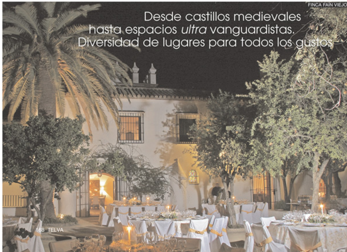
FINCA FAÍN VIEJO

Desde castillos medievales hasta espacios ultra vanguardistas. Diversidad de lugares para todos los gustos